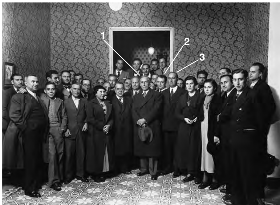
FOTOGRAFIA 15. Un grup de components d'Acció Valenciana amb Pompeu Fabra (1), R. Aramon (2) i J. M. de Casacuberta (3), que anaren a València (1935) per tal de tractar qüestions de toponímia.