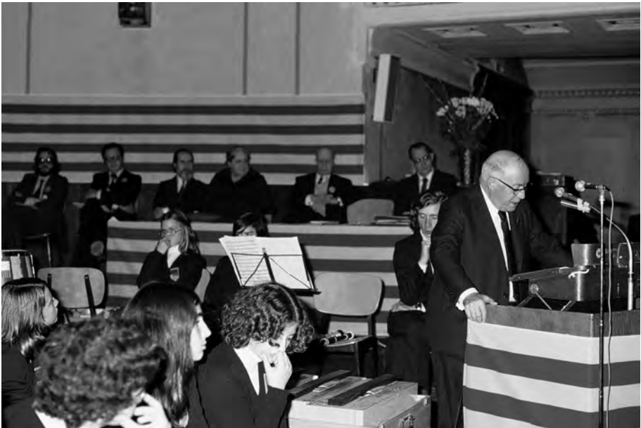
FOTOGRAFIA 45. L'any 1977 Ramon Aramon presidí els Jocs Florals de Munic, «els darrers que tindran lloc lluny de Barcelona, fora de l'àmbit de les terres catalanes», digué en el discurs presidencial, a l'exili.