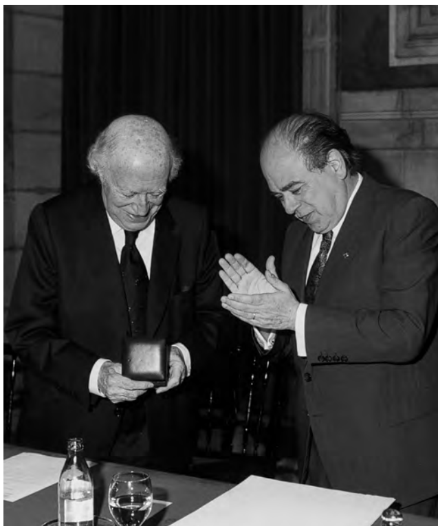
FOTOGRAFIA 59. L'any 1990 fou concedida la Medalla d'Or de la Generalitat de Catalunya a Ramon Aramon.