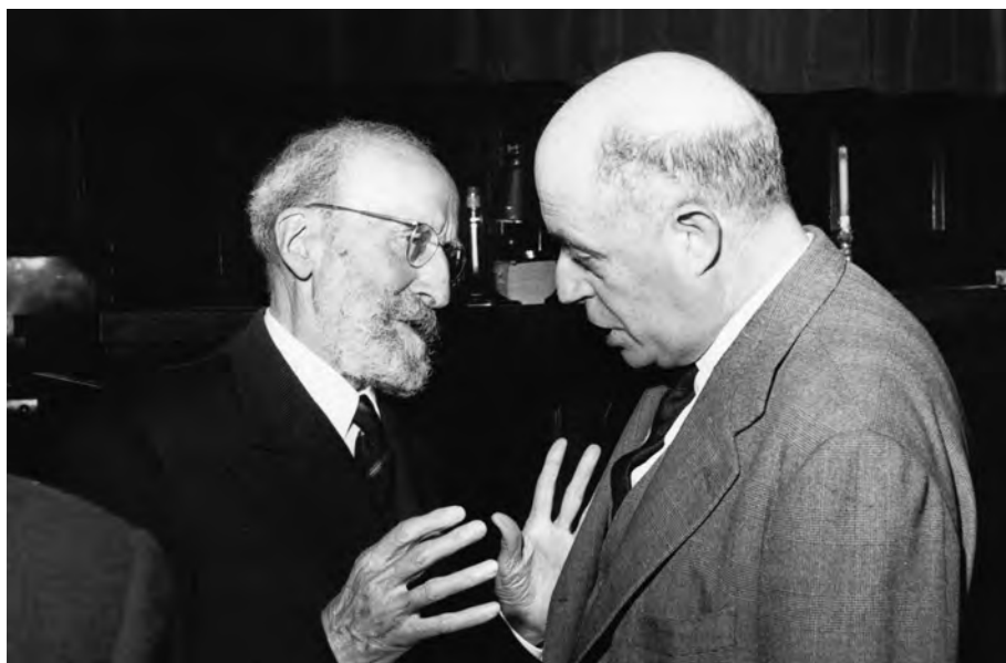
FOTOGRAFIA 7. Amb Ramón Menéndez Pidal, el mestre i l'amic perdurable.