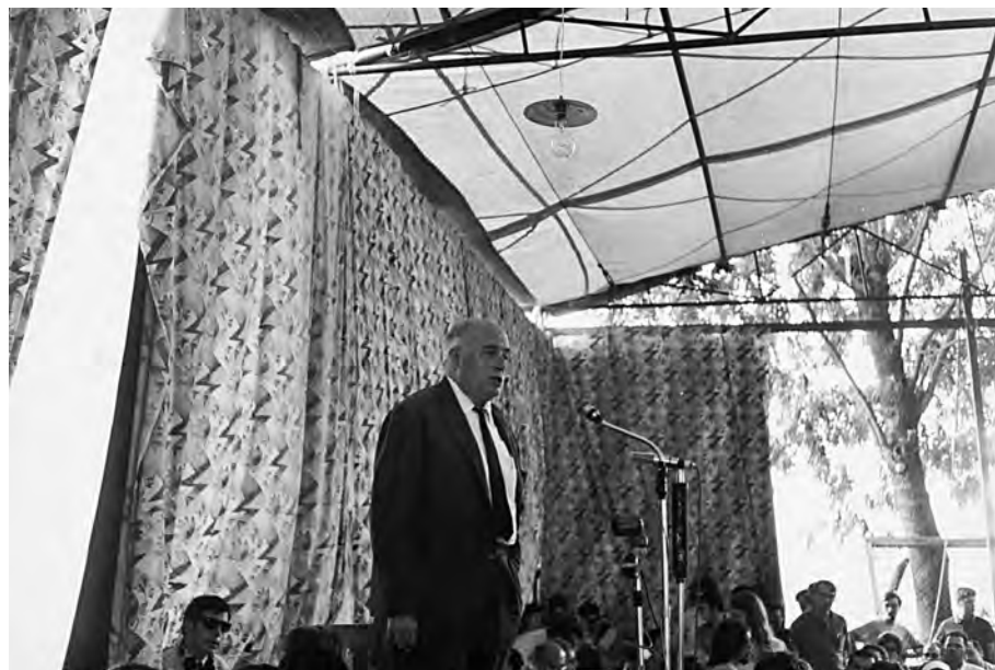
FOTOGRAFIA 35. L'agost de 1968 parlà a Cantonigròs invitat pel Concurs de Poesia.