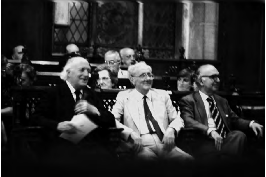
FOTOGRAFIA 48. L'any 1981, setanta-cinquè aniversari del Primer Congrés Internacional de la Llengua Catalana, al Saló de Cent de l'Ajuntament de Barcelona, Aramon, Moll i Sanchis i Guarner parlaren de la unitat de la llengua.