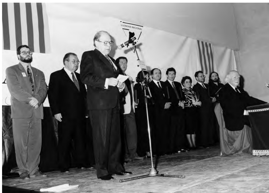
FOTOGRAFIA 61. El 1993 a les Drassanes de Barcelona se celebrà un multitudinari homenatge popular a Ramon Aramon, organitzat per l'associació Llengua Nacional. Per primera vegada s'hi concedí el Premi a la Lleialtat Lingüística Ramon Aramon i Serra. Ramon Aramon i els premiats escolten les paraules de Jordi Pujol, president de la Generalitat de Catalunya.