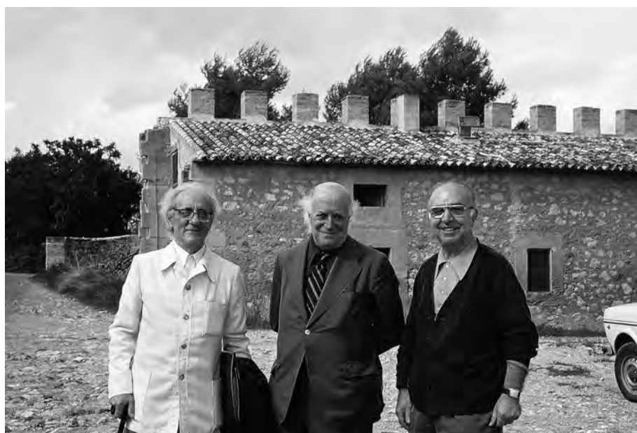
FOTOGRAFIA 43. Francesc de B. Moll, Ramon Aramon i Manuel Sanchis i Guarner, a Mallorca, el 1979, en ocasió de les Festes Populars de Cultura Pompeu Fabra.